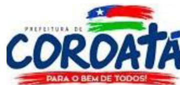
PREFEITURA MUNICIPAL DE COROATÁ