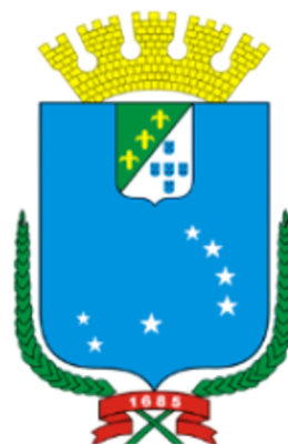
Prefeitura Municipal de São Luís/MA.

Trabalhando para todos. Gestão: 2025/2028